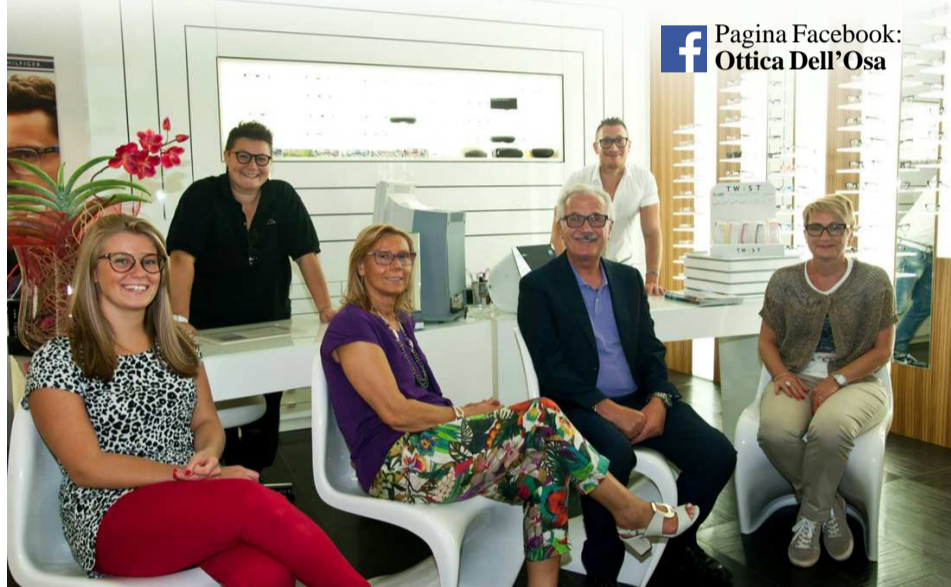
Pagina Facebook: Ottica Dell'Osa